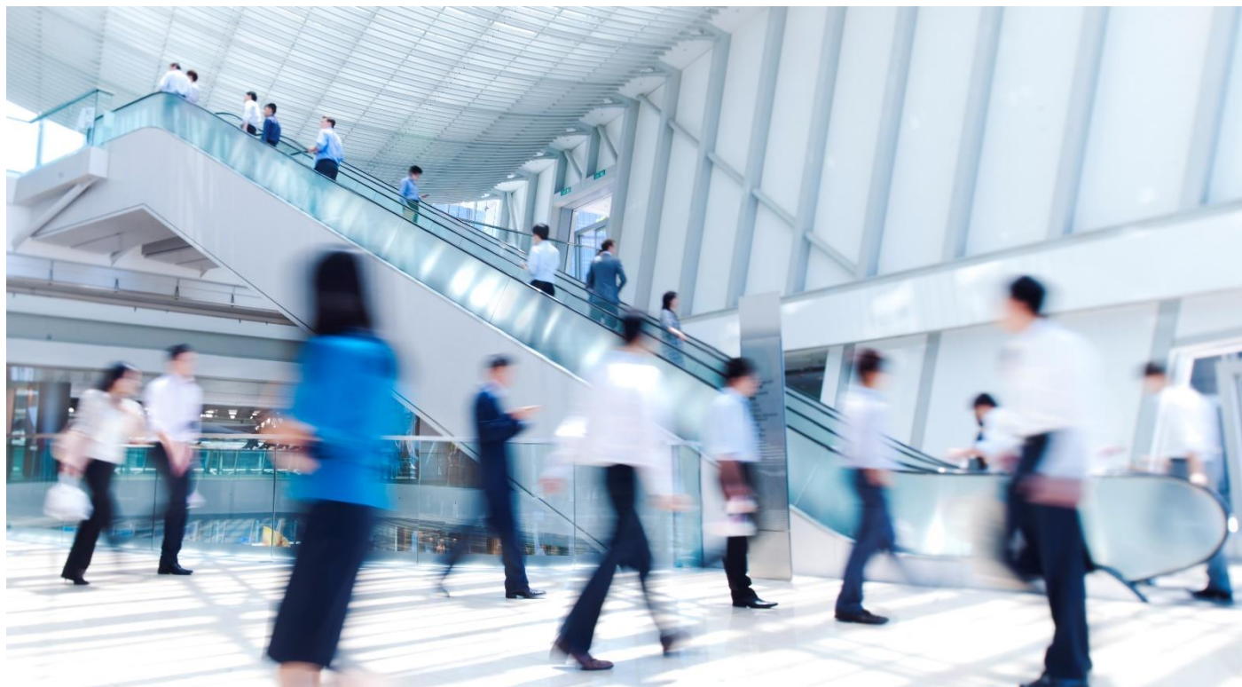
表一：招商引资的措施